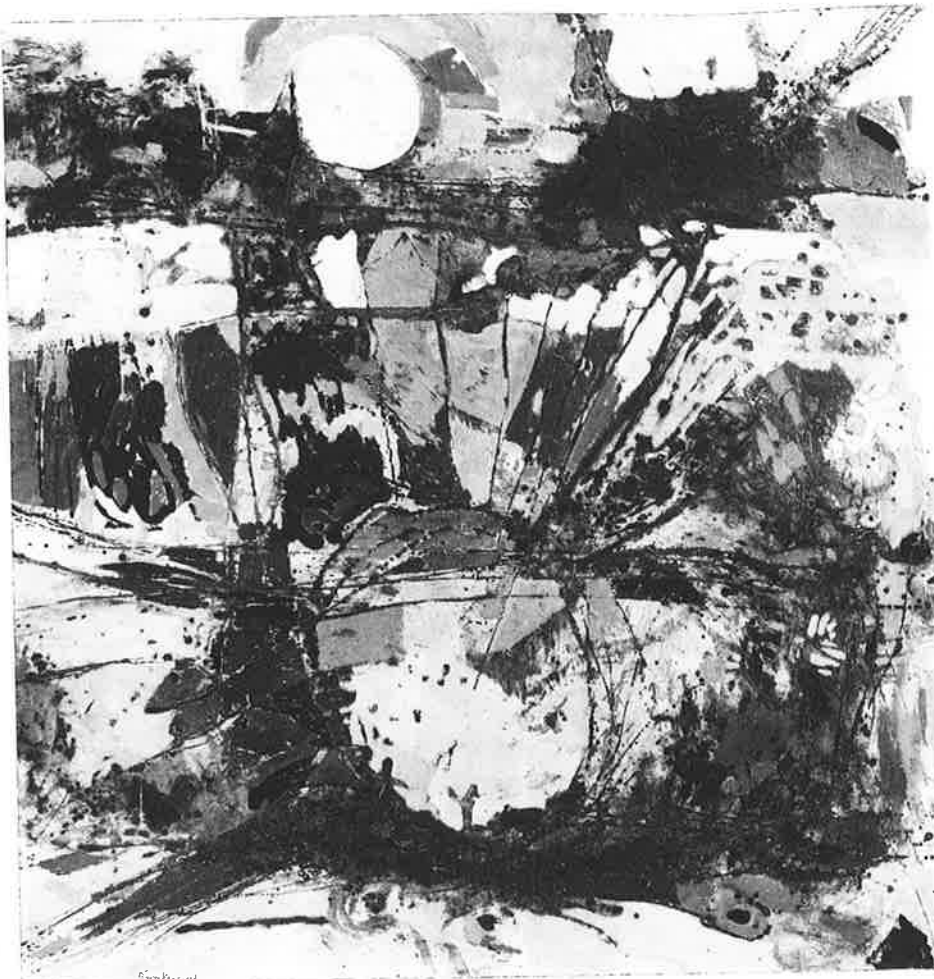
« Chanté le matin »