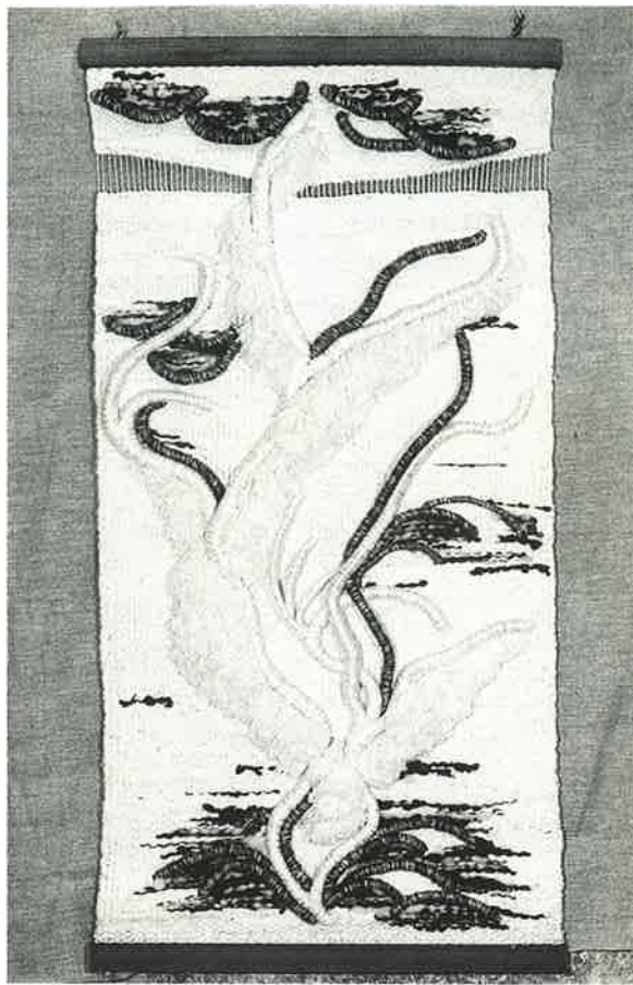
"Le Sacre du printemps" 230 cm x 115 cm

1986 : Médaille d'Or du Meilleur Ouvrier de France.